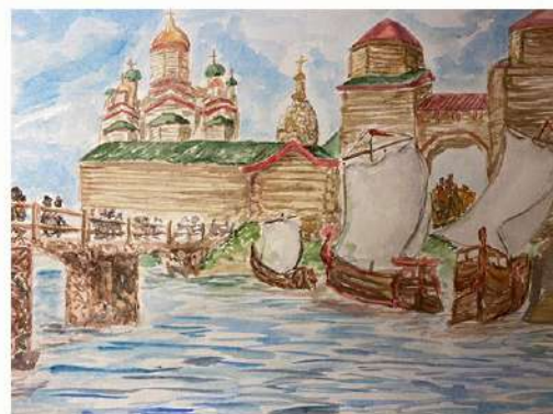
Минаева Наталья 8 Д