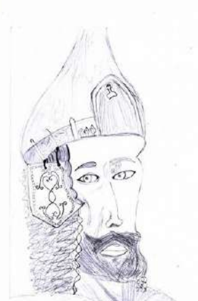
Никитенко Ксения 5 С /12